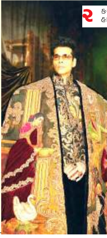
2 કરણ જોહર: મનીષ મલ્હોત્રાના સમૂહમાં પહેલી વાર હાજર રહેતા, કરણનો દેખાવ રાજા રવિ વર્માની શૈલીથી