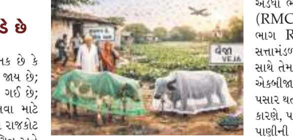
પોતાની દીકરીના લગ્ન ગામના છોકરાઓ સાથે નહીં કરે.” સાંજ પડતાં જ બહારના લોકો ગામ છોડી દે છે, કારણ કે આ મચ્છરો વચ્ચે રાત વિતાવવી અશક્ય છે. ગ્રામજનોની દુર્દશા એવી છે કે તેમને તેમના ઘર (ગાય અને ભેસ) ને બચાવવા માટે વિશાળ મચ્છરદાની બાંધવી પડી છે. મચ્છર કરડવાથી પ્રાણીઓ બીમાર થઈ રહ્યા છે અને તેમના દૂધ ઉત્પાદનમાં ઘટાડો થઈ રહ્યો છે. વેજા ગામનું ભૌગોલિક સ્થાન તેનું સૌથી મોટું દુ:ખન બની ગયું છે. ગામનો

વેજા ગામમાં મચ્છરો એટલા ભયાનક છે કે મહેમાનો સાંજ પડતા પહેલા ભાગી જાય છે; પાણીની જળચરો એક સમસ્યા બની ગઈ છે; હવે વહીવટીતંત્ર પરિસ્થિતિને ઉકેલવા માટે લખનો મોડેલ અપનાવશે. ગુજરાતના રાજકોટ જિલ્લાનું વેજા ગામ હાલમાં એક વિચિત્ર અને અસંત ગંભીર કટોકટીનો સામનો કરી રહ્યું છે. મચ્છરોની વસ્તી એટલી વધી ગઈ છે કે સાંજ પડતાં જ ગામમાં “મચ્છર કફરું” લાગુ થઈ ગયો છે. સ્થાનિક લોકો કહે છે કે મચ્છરોના ટોળા હુમલો કરે છે, જેના કારણે શરીરોમાં ચાલવું પણ મુશ્કેલ બની જાય છે. ગામની પરિસ્થિતિ એટલી વિકટ છે કે કોઈ પણ મહેમાન રાત રોકાવા તૈયાર નથી. ગ્રામજનોએ એક દુ:ખદ સત્ય જાહેર કર્યું, “જો આ પરિસ્થિતિ ચાલુ રહી, તો કોઈ પણ