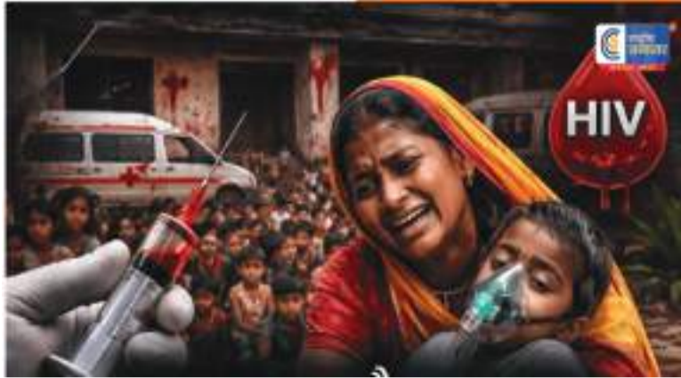
શીશીઓ પર જૂની સિરીજનો ઉપયોગ કરતો નિયમો સાથે અસંગત હોવાનું જણાયું. જોવા મળ્યો. તબીબી કચરાનો નિકાલ પણ

લાહોર. પાકિસ્તાનના તૌસામાં આવેલી THQ હોસ્પિટલમાંથી ભયાનક સમાચાર સામે આવ્યા છે. એક ગુપ્ત તપાસમાં જાણવા મળ્યું છે કે હોસ્પિટલના સ્ટોક બેદરકારી દ્વારા એક જ સિરીજનો વારંવાર ઉપયોગ કર્યો હતો. પરિણામે, ઓક્ટોબર 2025 થી ઓક્ટોબર 2026 વચ્ચે 331 બાળકો HIV પોઝિટિવ હોવાનું જાણવા મળ્યું છે.