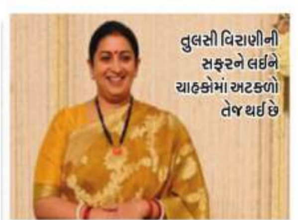
તુલસી વિરાણીની સફરને લઈને યાહકોમાં અટકળો તેજ થઈ છે

છે. તેમનાં ગાયેલાં અનેક સુપરહિટ ગીતોમાં ‘ચોલી કે પીએલે કુલ્લ હોતા હે, હમ તુમ જેવાં ગીતોનો સમાવેશ થાય છે. અભિનેતા અને ફિલ્મ નિર્માતા આર.માધવનને પદ્મશ્રીથી સન્માનિત કરવામાં આવ્યા છે. સમારોહ દરમિયાન તેની પત્ની સરિતા અને પુત્ર વેદાંત ઉપસ્થિત રહ્યાં હતાં અને ગર્વભરે તાળીઓ પાડી હતી. સન્માન પ્રાપ્ત કર્યાં માફ માધવને જણાવ્યું હતું કે, “હું આને માત્ર એવોર્ડ જોઈ છું, હું એક સન્માનને ગૌરવ, કેન્દ્રીય ગુડમંડ્રી અર્થિત શાહ સહિત અનેક મહાનુભાવો સમારોહમાં હાજર રહ્યા હતા.