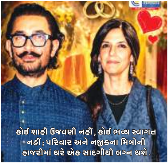
કોઈ શાદી ઉજવણી નહીં, કોઈ ભવ્ય સ્વાગત નહીં; પરિવાર અને નજીકના મિત્રોની હાજરીમાં ઘરે એક સાદગીથી લગ્ન થશે.

બોલીવૂડના મિસ્ટર પરફેક્શનિસ્ટ આમિર ખાન ટૂંક સમયમાં એક નવું જીવન શરૂ કરી રહ્યા છે. અભિનેતાએ પુષ્ટિ આપી છે કે તે 5 જુલાઈના રોજ તેની ગર્લફ્રેન્ડ ગૌરી સ્પોટ સાથે લગ્ન કરશે. લગ્ન કોઈ ભવ્ય હોટેલ, ડેસ્કેન્ડેન્સ વેડિંગ અથવા ભવ્ય સમારોહમાં નહીં, પરંતુ ખૂબ જ સરળ અને ખાનગી વાતાવરણમાં થશે. આમિર ખાન તાજેતરના એક ઈન્ટરવ્યુમાં તેના લગ્નની યોજનાઓ વિશે ખુલ્લેઆમ વાત કરી. અભિનેતાએ ખુલાસો કર્યો કે તે અને ગૌરી સ્પોટ એક સાદગીથી રજિસ્ટર્ડ લગ્ન કરશે, જેમાં ફક્ત બંને પરિવારના સભ્યો અને થોડા ખૂબ જ નજીકના મિત્રો જ હાજરી આપશે.