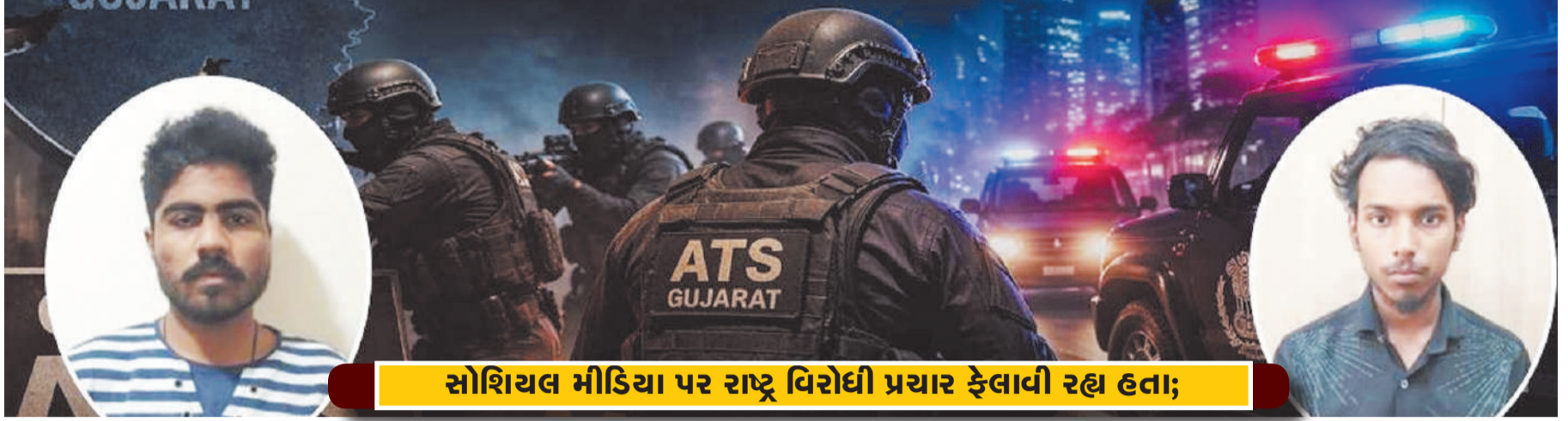
સોશિયલ મીડિયા પર રાષ્ટ્ર વિરોધી પ્રચાર ફેલાવી રહ્યા હતા;

યુએસ પ્રમુખ ડોનાલ્ડ ટ્રમ્પે કહ્યું કે તેમણે શાંતિ વાટાઘાટો પૂર્ણ ન થાય ત્યાં સુધી ઈરાન સાથે યુદ્ધવિરામ લંબાવ્યો છે, જોકે અગાઉ તેને લંબાવવાનું વચન આપ્યું હતું. તેમણે કહ્યું કે યુએસ ઈરાનની બંધોની નાકાબંધી ચાલુ રાખશે, જેને ઈરાનના વિદેશ મંત્રીએ અગાઉ "યુદ્ધનું ફત્વું" ગણાવ્યું હતું. ઈરાન વિરોધ: એક વરિષ્ઠ ઈરાની સલાહકારે કહ્યું કે વિસ્તરણ "કોઈ અર્થ નથી" અને તેહરાને લશ્કરી કાર્યવાહી કરવી જોઈએ. દરમિયાન, ઈરાનના યુએન રાષ્ટ્રકોષ્ટક કહ્યું કે તેમને વિશ્વાસ છે કે જો યુએસ નાકાબંધી સમાપ્ત કરે તો વાટાઘાટો થશે. પાકિસ્તાન પ્રવાસ રદ: ટ્રમ્પની બહેરાત બાદ, ઉપરાષ્ટ્રપતિ જેડી વાન્સનો ઈરાન સાથે વાટાઘાટોનું નેતૃત્વ કરવા માટે ઈસ્લામાબાદનો પ્રવાસ એક દિવસ માટે રદ કરવામાં આવ્યો, વ્હાઈટ હાઉસના એક અધિકારીના જણાવ્યા અનુસાર. પ્રેસિડેન્ટ ડોનાલ્ડ ટ્રમ્પે કહે છે કે જ્યાં સુધી ઈરાન પ્રસ્તાવ રજૂ ન કરે અને વાટાઘાટો પૂર્ણ ન કરે ત્યાં સુધી અમેરિકા ઈરાન સાથે યુદ્ધવિરામ લંબાવી રહ્યું છે. તેહરાને અગાઉ કહ્યું હતું કે તે "ધમકીઓના પડછાયા" અથવા યુએસ નૌકાદળના નાકાબંધી હેઠળ વાટાઘાટો કરશે નહીં. પેલેસ્ટાઇન કેડ કેસન્ટ સોસાયટીના જણાવ્યા અનુસાર, કબજા હેઠળના પશ્ચિમ કાંઠામાં ઘરાચાયલી વસાહતોના રહેવાસીઓ દ્વારા કરવામાં આવેલી ગોળીબારમાં એક બાળક સહિત બે લોકો માર્યા ગયા છે. ઘરાચાયલે દક્ષિણ લેબનોન પર બોમ્બમારો ચાલુ રાખ્યો, કાકિલાત અલ-જિસ્ર શહેર પર હવાઈ હુમલો કરીને છ લોકો ઘાયલ થયા અને 10 દિવસના યુદ્ધવિરામનું ઉલ્લંઘન કરીને મિચામ શહેરમાં ઘરો તોડી પાડ્યા.