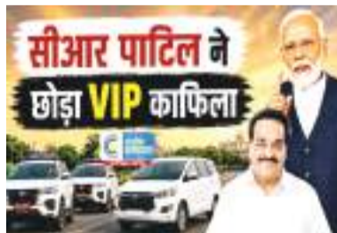
કે તેમના કાફલામાં પાર્કિંગ અને એસ્કોર્ટ વાહનોનો સમાવેશ ન કરવો. તેમણે ઈંધણ કાર્યક્ષમતા અને સરળતાને પ્રોત્સાહન આપવા માટે આ નિર્ણય લીધો હતો.

વડાપ્રધાન નરેન્દ્ર મોદીની તાજેતરની અપીલની અસર હવે કેન્દ્રીય મંત્રીઓના કાર્યમાં પ્રતિબિંબિત થઈ રહી છે. પીએમએ નાગરિકોને પેટ્રોલ અને ડીઝલનો વપરાશ ઘટાડવા, કારપૂલિંગ અને જાહેર પરિવહનને પ્રોત્સાહન આપવા વિનંતી કરી. આ દિશામાં એક પગલું ભરતા, કેન્દ્રીય જળ ઉર્જા મંત્રી સીઆર પાટીલે તેમના સત્તાવાર પ્રવાસોમાં પાર્કિંગ અને એસ્કોર્ટ વાહનોની જોગવાઈનો ઈન્કાર કર્યો છે.