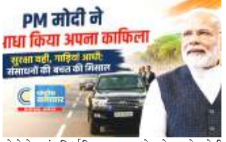
પ્રોટોકોલમાં નિર્ધારિત સુરક્ષા ધોરણો સાથે કોઈ સમાધાન કરવામાં આવ્યું નથી.

નવી દિલ્હી: હેડરાબાદના નાગરિકોને ઈંધણ અને સંસાધનોની બચત કરવાની અપીલ કર્યા પછી પ્રધાનમંત્રી નરેન્દ્ર મોદીએ પોતે તેમના સુરક્ષા કાફલાને અડધો કરવાનો નિર્ણય લીધો છે. સૂત્રો અનુસાર, પીએમ મોદીએ તેમના સ્પેશિયલ પ્રોટેક્શન ગ્રુપ (SPG) ને તેમના કાફલામાં વાહનોની સંખ્યા 50% ઘટાડવાનો નિર્દેશ આપ્યો છે. આ ફેરફાર વડોદરા અને ગુવાહાટીની તેમની તાજેતરની મુલાકાતો દરમિયાન પણ જોવા મળ્યો હતો. નોંધપાત્ર રીતે, વાહનોની સંખ્યામાં ઘટાડો થવા છતાં, “બહુ બુક” અને SPG ના સુરક્ષા