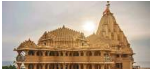
હાલનું સોમનાથ મંદિર અરબી સમુદ્રના કિનારે ભવ્ય રીતે ઉભું છે.