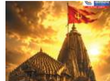
નુકસાન થયું હતું ઇતિહાસકારોના મતે, મંદિર પર લગભગ ૧૭ વખત હુમલો કરવામાં આવ્યો હતો, પરંતુ દરેક વખતે તેનું પુનર્નિર્માણ કરવામાં આવ્યું હતું.

સોમનાથને ભગવાન શિવના ૧૨ જ્યોતિર્લિંગોમાંનું પ્રથમ માનવામાં આવે છે. પુરાણો અનુસાર, ભગવાન ચંદ્રદેવે ભગવાન શિવની કઠોર તપસ્યા કરીને અહીં શ્રાપથી મુક્તિ મેળવી હતી. એવું માનવામાં આવે છે કે ચંદ્રદેવે પહેલા સોનાનું મંદિર બનાવ્યું હતું, પછી રાવણે તેને ચાંદીનું બનાવ્યું હતું, અને પછી ભગવાન કૃષ્ણે ચંદ્રના લાકડાનું મંદિર બનાવ્યું હતું.