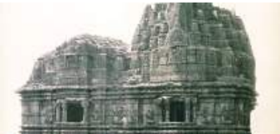
ઘણી વખત નાશ પામ્યો, દરેક વખતે ફરીથી બનાવવામાં આવ્યો: મહમૂદ ગઝનવીથી ઓરંગઝેબ સુધીના વર્તમાન સોમનાથ મંદિરના પુનર્નિર્માણની સંપૂર્ણ વાર્તા જાણો.

મહાદેવનું વરદાન અને 'સોમનાથ' જ્યારે ચંદ્રદેવનું અસ્તિત્વ જોખમમાં હતું, ત્યારે તેમણે પ્રભાસ પાટણ દરિયા કિનારે એક શિવલિંગ સ્થાપિત કર્યું અને કઠોર તપસ્યા કરી. તેમની ભક્તિથી પ્રસન્ન થઈને, ભગવાન શિવે તેમને વરદાન આપ્યું કે તેમનું તેજ ક્યારેય સંપૂર્ણપણે ઓછું નહીં થાય. તે શુકલ પક્ષ (ચંદ્રનો મીણ ચરણ) દરમિયાન વધશે અને કૃષ્ણ પક્ષ (ચંદ્રનો અસ્ત થવાનો તબક્કો) દરમિયાન ઘટશે. આમ, ચંદ્રને નવું જીવન આપવામાં આવ્યું, અને શિવ તેના સ્વામી બન્યા, જેનો અર્થ "સોમનો સ્વામી" થાય છે.