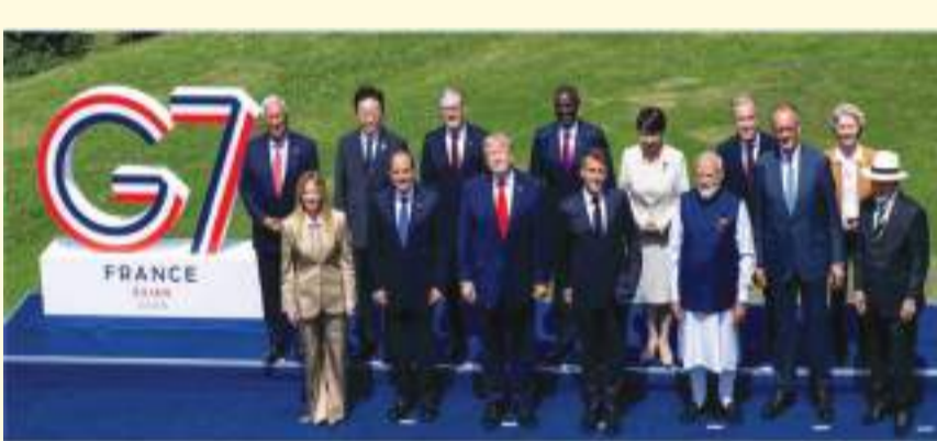
વડાપ્રધાન મોદીએ નાવીકોના મોતનો મુદ્દો ઉઠાવ્યો: યુદ્ધનો કાયમી ઉકેલ ફક્ત સંવાદ, રાજદ્વારી અને આંતરરાષ્ટ્રીય સહયોગ દ્વારા જ શક્ય

અમેરિકન રાષ્ટ્રપતિ ડોનાલ્ડ ટ્રમ્પની ટૂંકી ટિપ્પણીએ પણ લોકોનું ધ્યાન ખેંચ્યું. યુરોપિયન કોન્સિલના પ્રમુખ એન્ટોનિયો કોસ્ટા સાથેની વાતચીત દરમિયાન, ટ્રમ્પે અચાનક "ગ્રીનલેન્ડ" નો ઉલ્લેખ કર્યો. જોકે વાતચીતનો સંપૂર્ણ ટેક્સ્ટ જાહેર કરવામાં આવ્યો ન હતો, પરંતુ ગ્રીનલેન્ડ વિશે ટ્રમ્પની અગાઉની ટિપ્પણીઓને કારણે આ શબ્દ ચર્ચાનો વિષય બન્યો.