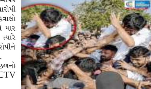
હતી. પ્રદર્શનકારીઓ NEET પેપર લીક, ભરતી પરીક્ષાઓમાં કથિત અનિયમિતતાઓ, શિક્ષણ

આ ઘટનાથી વિરોધીઓ અને સમર્થકોમાં વ્યાપક ગુસ્સો ફેલાયો. ઘટનાસ્થળે હાજર લોકોએ આરોપી યુવકને પકડવાનો પ્રયાસ કર્યો. કેટલાક અહેવાલો અનુસાર, યુવકને ટોળાને પકડી લીધો અને માર માયો. પરિસ્થિતિ વધુ વણસી રહી હતી, ત્યારે પોલીસે તાત્કાલિક હસ્તક્ષેપ કર્યો અને આરોપીને બીડમાંથી બહાર કાઢીને કસ્ટરીમાં લઈ લીધો. પોલીસ અધિકારીઓએ જણાવ્યું કે હુમલા પાછળનો હેતુ શોધવા માટે પ્રયાસો ચાલી રહ્યા છે. CCTV ફૂટેજની પણ તપાસ કરવામાં આવી રહી છે. જે કાર્યક્રમ દરમિયાન આ ઘટના બની તે યુવાનોના પ્રશ્નોના ઉકેલ માટે આયોજિત કરવામાં આવી