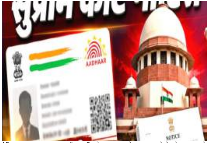
ઈમિગ્રેશન નબળા ચકાસણી પદ્ધતિઓ આધાર કાર્ડ મેળવી રહ્યા છે અને ત્યારબાદ મતદાર ઓળખ કાર્ડ સહિત અન્ય ઓળખ દસ્તાવેજો મેળવવા માટે આધારનો મૂળભૂત દસ્તાવેજ તરીકે ઉપયોગ કરી રહ્યા છે.

અરજી અનુસાર, આધાર કાયદાની કલમ 9 સ્પષ્ટપણે જણાવે છે કે આધાર નાગરિકતા અથવા રહેઠાણનો પુરાવો નથી, જ્યારે 22 ઓગસ્ટ, 2023 ના UIDAI સૂચનામાં સ્પષ્ટતા કરવામાં આવી છે કે આધાર ફક્ત ઓળખનો પુરાવો છે, નાગરિકતા, સરનામું અથવા જન્મ તારીખનો પુરાવો નથી. અરજીમાં દલીલ કરવામાં આવી હતી કે આ કાનૂની દરજ્જો ધોવા છતાં, આધારનો ઉપયોગ શાળા પ્રવેશ, મતદાર નોંધણી, રેશન કાર્ડ મેળવવા, ગ્રાઈવિંગ લાઈસન્સ મેળવવા, મિલકત ખરીદવા અને નાગરિકતા, રહેઠાણ અથવા ઉમરના પુરાવા જરૂરી અન્ય હેતુઓ માટે વ્યાપકપણે થઈ રહ્યો છે. અરજદારે આરોપ લગાવ્યો હતો કે ઘુસણખોરો અને ગેરકાયદેસર