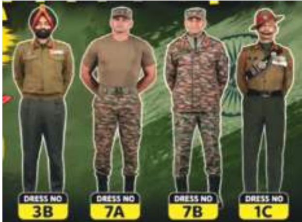
'3B' ડ્રેસ કોડ શું છે?

ભારતીય સેનાએ તેના ડ્રેસ નિયમોમાં નોંધપાત્ર ફેરફારો કર્યા છે, જેમાં અનેક નવા ગણવેશનો સમાવેશ થાય છે. નવા નિયમો હેઠળ, યુનિફોર્મ યાદીમાં એક નવું શિયાળાનું જેકેટ, કોમ્બેટ ટી-શર્ટ અને ઔપચારિક ડ્રેસ ઉમેરવામાં આવ્યા છે. સેના માને છે કે આ ફેરફારો સમયની જરૂરિયાતો અને કાર્યક્ષમતાને ધ્યાનમાં રાખીને કરવામાં આવ્યા છે. નવી સિસ્ટમ સૈનિકો અને અધિકારીઓ બંને માટે કેટલાક ડ્રેસ કોડમાં એકરૂપતા પણ લાવે છે, જ્યારે અધિકારીઓ માટે ખાસ કરીને નવા શિયાળાના ગણવેશને પણ મંજૂરી આપવામાં આવી છે.