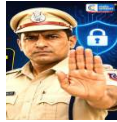
જો તમારું ફેસબુક અથવા ઈન્સ્ટાગ્રામ એકાઉન્ટ હેક થઈ ગયું હોય, તો તમે બંને પ્લેટફોર્મ માટે સત્તાવાર સહાય કેન્દ્રોની મુલાકાત લઈને ફરિયાદ નોંધાવી શકો છો. વપરાશકર્તાએ તેમની ઓળખ માહિતી પ્રદાન કરવી આવશ્યક છે, ત્યારબાદ પ્લેટફોર્મ એકાઉન્ટની ચકાસણી કરશે. એકવાર તપાસ પૂર્ણ થઈ જાય, પછી શંકાસ્પદ લોગિન ધરાવતું એકાઉન્ટ દૂર કરી શકાય છે, અને ઈમેઈલ દ્વારા વપરાશકર્તાને અપડેટ મોકલવામાં આવે છે.

દિલ્હી. આ ડિજિટલ યુગમાં, WhatsApp, Facebook અને Instagram હવે ફક્ત સોશિયલ મીડિયા પ્લેટફોર્મ નથી રહ્યા, પરંતુ આપણા અંગત જીવન, યાદો, સંપર્કો અને અન્ય ઘણી મહત્વપૂર્ણ માહિતીનો ભાગ બની ગયા છે. તેથી, જો તમારું સોશિયલ મીડિયા એકાઉન્ટ અચાનક હેક થઈ જાય, તો ચિંતા થવી સ્વાભાવિક છે. તાજેતરમાં, દિલ્હી પોલીસે તેના સત્તાવાર સોશિયલ મીડિયા પ્લેટફોર્મ પર એક વિડિયો બહાર પાડ્યો છે, જેમાં લોકોને માહિતી આપવામાં આવી છે કે જો તમારું WhatsApp, Facebook અથવા Instagram એકાઉન્ટ હેક થઈ જાય તો ગભરાવાની જરૂર નથી. થોડા આવશ્યક પગલાં લઈને, એકાઉન્ટ ફરીથી સુરક્ષિત કરી શકાય છે.