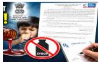
આવશે નહીં. નવો નિયમ શું છે? ડ્રગ્સ (5મો સુધારો) નિયમો, 2026, 9 જૂનના રોજ જારી કરાયેલા એક જાહેરનામા હેઠળ લાગુ કરવામાં આવ્યા છે. આ અંતર્ગત, ડ્રગ્સ રૂલ્સ, 1945 ના શેડ્યુલ K માંથી "સીરપ"

- આરોગ્ય મંત્રાલયના નવા નિયમો 1 જાન્યુઆરી, 2027 થી દેશભરમાં અમલમાં આવશે. - તમામ પ્રકારના સિરપ ખરીદવા માટે ડૉક્ટરનું પ્રિસ્ક્રિપ્શન ફરજિયાત દિલ્હી. આરોગ્ય અને પરિવાર કલ્યાણ મંત્રાલયે દવાઓની સલામતી અને તેમના જવાબદાર ઉપયોગને સુનિશ્ચિત કરવા માટે નવા નિયમો જાહેર કર્યા છે. મંત્રાલય દ્વારા જારી કરાયેલા એક જાહેરનામા અનુસાર, કફ સિરપ સહિત તમામ સીરપ આધારિત દવાઓ હવે ડૉક્ટરના પ્રિસ્ક્રિપ્શન વિના વેચવામાં