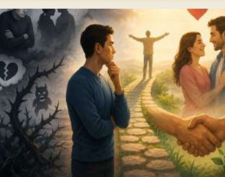
શંકા તણો નથી ઇલાજ તેને જરૂર રાખો, શબ્દો કરવાં તીક્ષ્ણ નથી નક્કી તેને મારો.